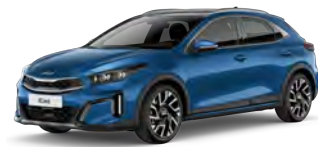
Modrá Flame (B3L)