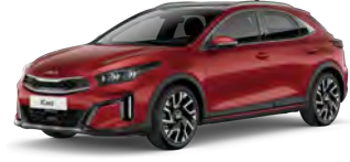
Červená Infra (AA9)