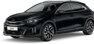
Perleťová Černá (1K)