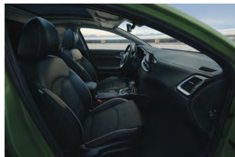
Čalounění v kombinaci látka/umělá kůže - standard pro Exclusive a TOP