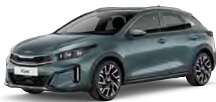
Šedá Yucca Steel (USG) - není dostupná pro GT-Line