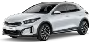
Perleťová Bílá Deluxe (HW2)