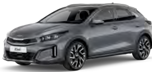
Stříbrná Lunar (CSS)