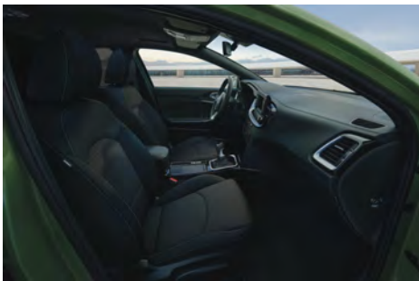
Látkové čalounění - standard pro Comfort