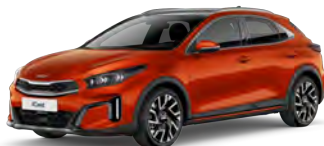
Oranžová Fusion (RNG) - není dostupná pro GT-Line