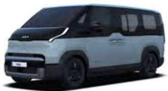
Modrá Frost (EBB) Pastelová