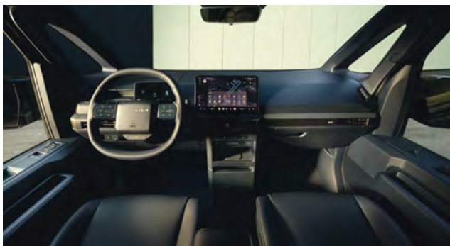
Provedení interiéru Modrá Navy v kombinaci látky / umělá kůže (DDV)