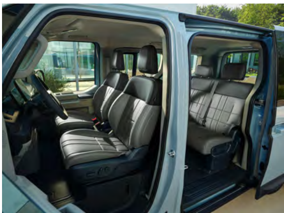
Provedení interiéru Šedá Human Light v umělé kůži (CJL) - příplatková pro Elite