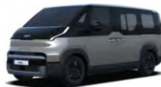
Šedá Steel (KLG)