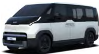
Perleťová bílá Snow (SWP)