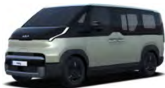
Zelená Mint (SML)