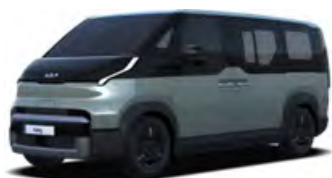
Šedá Lakehouse (LHG)