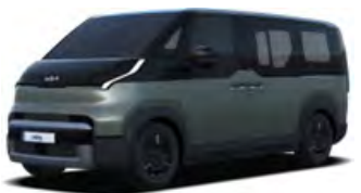
Zelená Cityscape (CGE)