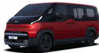
Červená Runway (CR5)