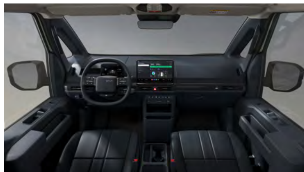
Provedení interiéru Modrá Navy v umělé kůži (DDV) - příplatková