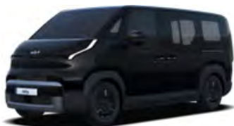
Peleťově černá Aurora (ABP)