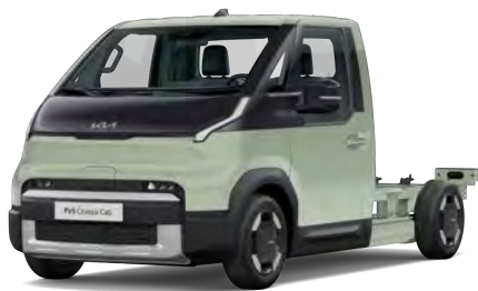
Zelená Mint (SML)