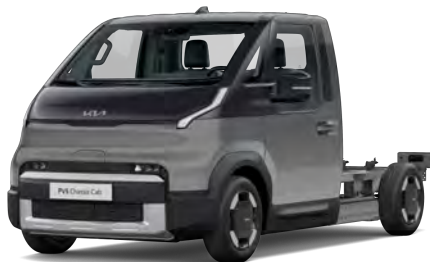
Šedá Steel (KLG)