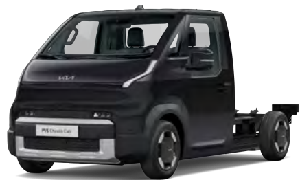
Peleťově černá Aurora (ABP)