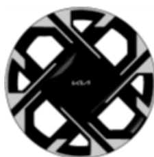
18" disky a pneumatikami 235/45R18 TOP