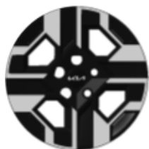
16" disky a pneumatikami 205/60R16 Comfort SPIN Exclusive