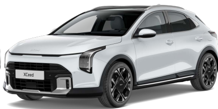
Perleťová Bílá Deluxe (HW2) Metalíza/perleťová