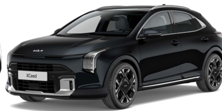
Perleťová Černá (1K) Metalíza/perleťová