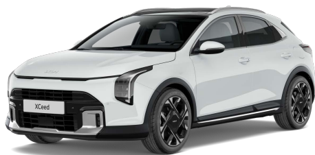
Bílá Cassa (WD)