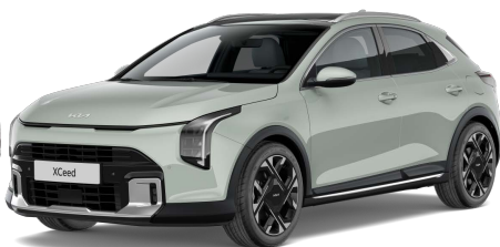
Morning Haze (DM8) Pastelová