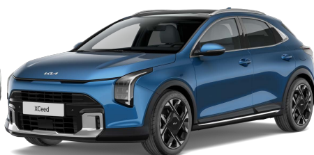
Modrá Flame (B3L) Metalíza