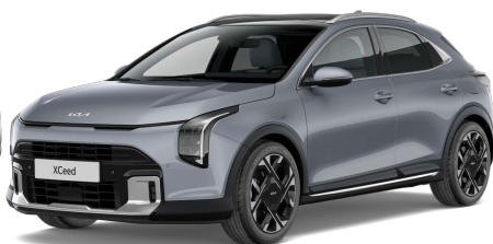
Stříbrná Lunar (CSS) Metalíza