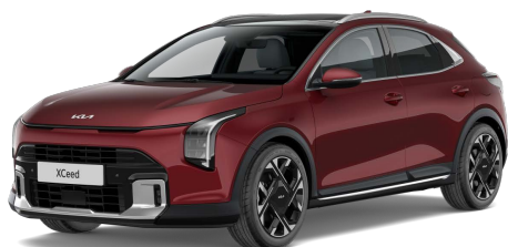
Červená Magma (ARD) Metalíza