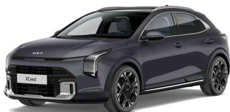
Šedá Penta Metal (H8G) Metalíza