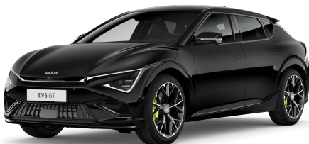
Perleťová černá Aurora (ABP)