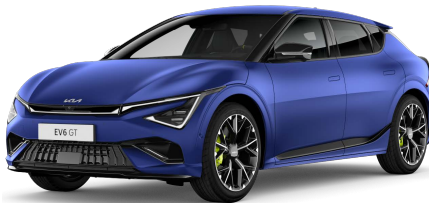
Matná modrá Yacht (DUM)