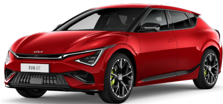
Červená Runway (CR5) Bez příplatku