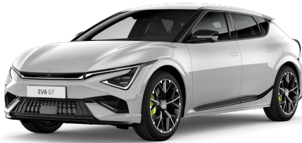
Šedá Wolf (C7S)