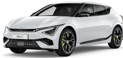
Perleťová bílá Snow (SWP)